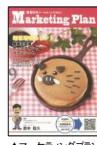
▲マーケティングプラン