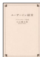
▲ユーザーイン経営